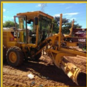
Niveleuse 140K 2015, 4000h Cabine ROPS climatisée Scarificateur Lame 4.3m Pneus 17.5R25