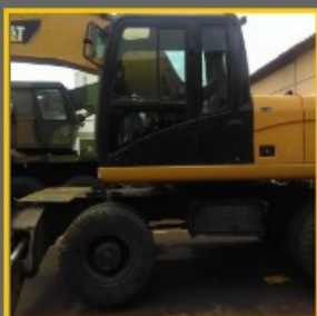
Pelle sur pneus M318 2015, 3800h Godet GD 1.1m³ Eclairage de travail Pneus 10R20